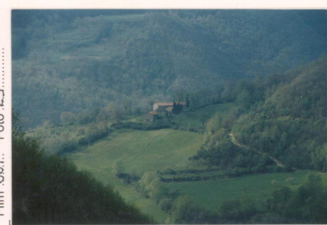
Film 361. Foto 29.