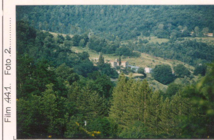
Film 441. Foto 2.