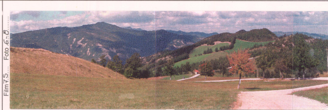
p.v. N. 1. Vista dalla strada di accesso.