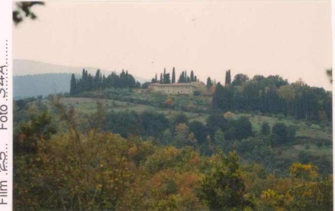
p.v. N. I. Cappuccini e La Barbolana da Tavernelle