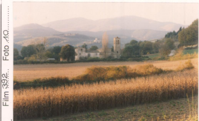
Film 392...