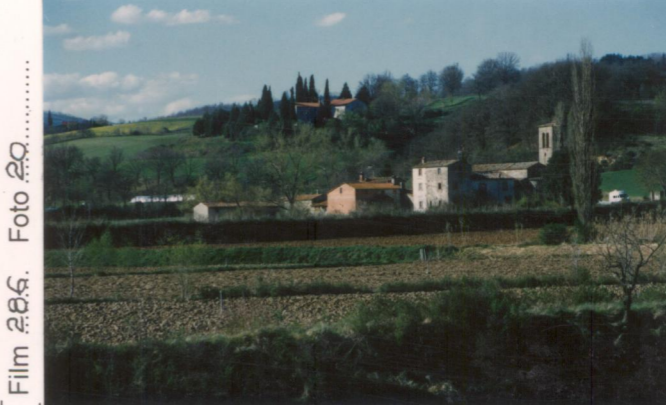
Film 286... Foto 20